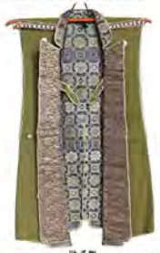
▲清阿道の助 陣羽織(福田寺所蔵)