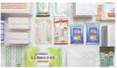
人人用ぬれタオル

今回の体験教室では、自分でお茶を点てたり、点ててもらったお茶をお菓子にいれたいたいたりする体験を行います。はじめてでも大丈夫。親子で楽しく茶道を体験してみよう！