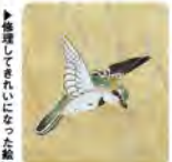
▲修理してきれいになった紙