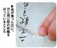
▲和紙がまたたくはつてお本の修理がはじまる

一方、和紙は洋紙が透明されるずっと前からあって、木を蒸して皮をむき、皮をたたいて細かくしたのから作ります。自然にやさしく丈夫で長持ち、それが和紙。博物館にかざられているような大事な本や絵を修理するときはかならず和紙を使います。じっさい世界中の博物館で高知の和紙をつくり名人の紙が使われているのです。