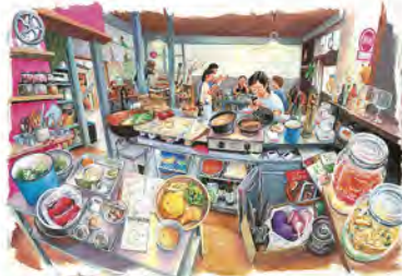
▲料理研究家「やっぱしごとば」(プロズ新社 2020年)より

また、近年の代表作で大ヒットとなっている大ピンチずかんシリーズは、よくあるピンチ、笑っちゃピンチ、冷や汗のピンチからなぜか哀愁を感じるピンチまで、さまざま