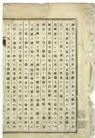
▲立志社設立縁起書 (近道コレクション／個人蔵・当館寄託)

9月20日(水)「oflove 市特市」 ●10時半～12時 ●1階研修室・アトリウム