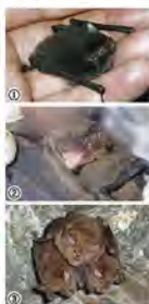
①クロホウシグコウモリ ②モリアブラコウモリ ③キクシラコウモリ