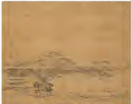
▲河田小龍(西江春望) 個人蔵

11月23日(土)、2025年1月3日(日) ミュージアムトーク 展示室で学芸員がお話します。 ●14時～14時30分 2025年1月2日(土)・3日(日) れきみんのお正月