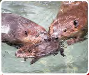
▲お父さんやお姉さんに運ばれるビーバーの子ども

〒781-5233 高知県香南市野市町大谷738 tel. 0887-56-3500 fax. 0887-56-3723 https://www.noichizoo.or.jp/