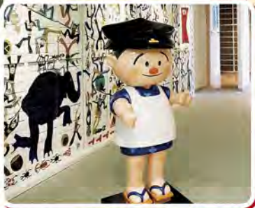
▲館入り口のフクちゃん。握手をするとごあいさつもしてくれるよ。

〒781-9529 高知市九反田2-1 高知市文化プラザかるぼーと内 tel. 088-883-5029 fax. 088-883-5049 https://www.kfca.jp/manganokan/