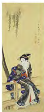
▲河田小龍(新演義美人図)安政元年(1854)、高知県立美術館蔵

●開館時間/午前9時～午後5時 (入場は午後4時30分まで) ●休館日/年末年始(12月27日～1月1日) ●観覧料 / 一般……970(290)円 (コレクション展) 大学生……260(200)円 高校生以下……無料