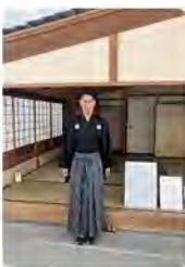
▲なりきり龍馬体験／次回は子どもサイズもあるよ!