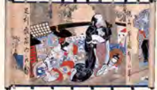
▲河田小龍(横軸(義経千本桜・加賀見山田御殿)) (部分) 当館蔵

11月1日(金)～2025年1月5日(日) 三館連携企画 生誕200年 河田小龍-土佐の人々とのつながり 幕末から明治の土佐を代表する絵師、河田小龍の生誕200年を記念して、県立坂本龍馬記念館、県立美術館、県立歴史民俗資料館の3館が連携して開催します。絵師であり、知識人でもあったマルチ面人小龍を知りつくす、またとない機会です。