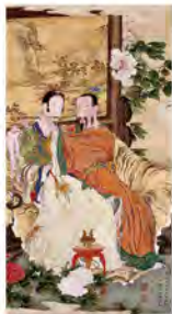
▲河田小龍(文楽中座巻首松竹図) 文久元年(1861)、 個人蔵・高知県立美術館寄託