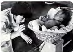
▲高知市小浜町市民会館での育児相談の風景。大きくなっていくかな?