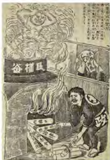
▲民権運動が熱い様子を表した風刺画(当館蔵)