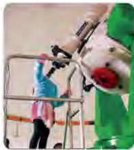
望遠鏡で人気の観望は、2月上旬まで見られる木星は4個のガリレオ衛星とともに繊細な模様まで見られます。

望遠鏡で人気の観望は、2月上旬まで見られる木星は4個のガリレオ衛星とともに繊細な模様まで見られます。西の空でくさきわ明るくひかる金星は望遠鏡で見るとま