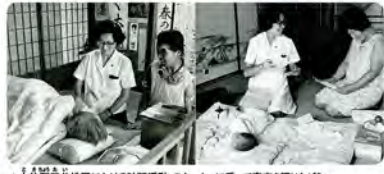
▲土佐町由井地区における訪問活動。スクーターに乗って家を訪ねながら赤ちゃんから高齢者まで健康状態を観察していました。

文書、写真、映像から紹介しています。当時の保健婦は青い制服を着て、体温計やメジャー等必要な道具が入った黒いかばんを持ち、自転車やスクーターに乗って家々を回っていました。保健婦から保健師となった現在においても、地域に入り、住民の健康を守るというスタイルは変わらず引き継がれています。