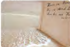
▲増強した景をイメージした道のプロジェクション