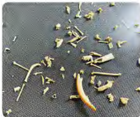
▲洞窟埋藏物中から採集した動物の骨