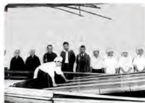
▲神宮紙をすいていた当時の様子