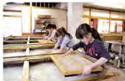
▲通常の紙すき体験

そしてこの神宮紙は大きいだけでなく、昔ながらの作り方にこだわって、とても手間をかけています。手間をかけている分、非常に丈夫で描