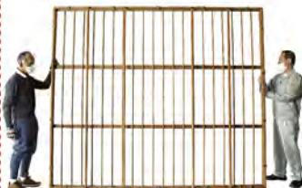
▲当時使われていた巨大な紙すき槽