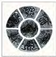
▲大吉祥齋貴昌(岸本太郎作・陶板)

「連携交流プロジェクト」の第一弾として、今年には新たに「広島県熊野町の筆」を加えて、「書」の伝統をつなぐ「展覧会」を安芸市で開催します。土日には各市町村が企画したワークショップも行うので、ぜひ体験しに来てね。