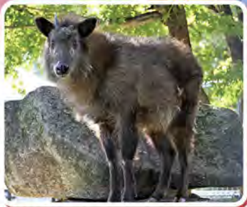
▲田舎産のニホンカモシカ

〒781-8010 高知市横橋通6丁目9番1号 tel. 088-832-0189 fax. 088-834-0929 https://www.city.kochi.kochi.jp/deeps/17/1712/animal/