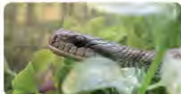
▲オオダイショウ(毒はありません)

高知県には毒をもち危険なへびもいますので、実際に展示しているへびや解説パネルを見て学んでく