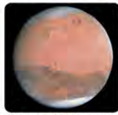
▲火星 NASA & JPL for OSIRIS Team MPO/UPD/LAM/IAA/RSO/INTA/UPM/DAS/IDA

「プラネタリウム番組」リバイバル！ プラネタリウムに夢中の小学生のみならず、この冬は科学館がこれまで放映してきたなかで好評だった番組たちを、一気に楽しみましょう。