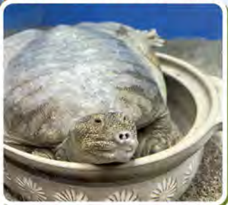
▲大人気の鎮にスッポン展示

〒781-0262 高知市浦戸778(桂浜公園内) tel.088-841-2437 fax.088-841-2451 https://www.katurahama-aq.jp e-mail: info@katurahama-aq.jp