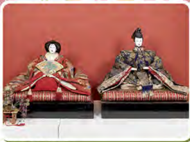
▲たつみやさんのおひなさま

〒784-0042 高知県安芸市土居953番地4 tel. fax. 0887-34-3706 https://www.city.aki.kochi.jp/rekimin/