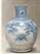
▲陶楽山景松文来入 図 / 中澤竹太郎

今年度も、大原先生におこなったき、修復作業を行いました。昨年10月には修復作業の見学を行い、20名ほどの方が参加されました。参加された方は修復作業の様子をじっくり見たり、大原先生の説明を聞いたりと、質問をしたりと充実した時間を過ごされました。修復のノウハウだけでなく、国・気候・風土によってもさまざまな配慮や違いがあることが知れた。修復の仕事の魅力を感じた。祖父の洋画作品がたくさんあるので、今後の整理に