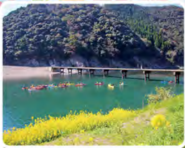
▲岩間沈下橋をくぐるカヌーツーリング

〒787-1323 高知県四万十市西土佐中半408-1 tel.0880-54-1230 fax.0880-31-9788 http://gakusya.info/jp/