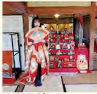
▲おひなさまに変身!